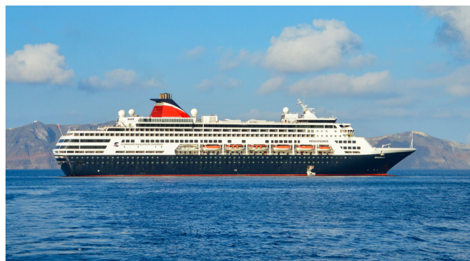
Au large de Santorin

Réservations : 0 801 34 22 22 • reservations@cfc-croisieres.fr